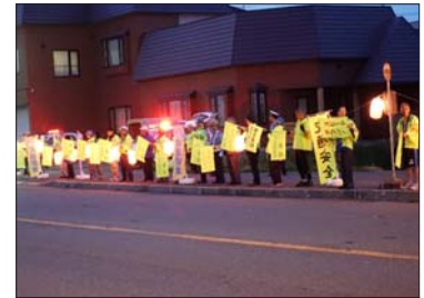
7月17日 富川提灯街頭啓発

7月、北海道飲酒運転の根絶に関する条例に基づき、北海道知事より発表がありました。