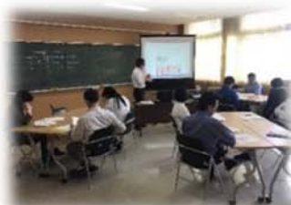
←チームになって 知恵を出し合いました

今後は今まで以上に調査書への記載内容が拡充されるということや、一般入試にも入学者本人が記載する部分がでてくるため、高校生活をどのように過ごし、学校外でもどのような取り組みをしたのかを具体的にしていける必要があることなどがわかりました。今後も研修を重ね、色々な意見を出し合い、研鑽を積んでいきたいと思っております。