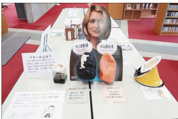
門別図書館で、健康な肺とそうでない肺のふくらみを体験できます

また、9月18日(火)～9月25日(火)まで門別公民館にて、栄養、健康、精神保健に関するパネルの展示を行います。この機会に門別図書館及び門別公民館に訪れ、健康づくりについて考えてみませんか。