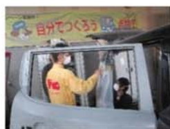
『昨年度の様子です』