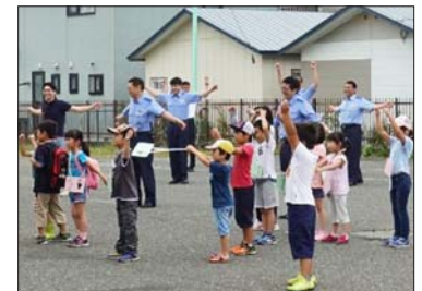
7月31日 門別警察署前ラジオ体操