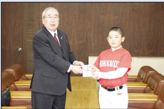
第3回全日本選抜小学生野球選手権淡路島大会

この日は、まだ積雪が少なく、第1リフトまでのオープンとなりましたが、他のコースも準備が整い次第、オープンしていく予定となっています。