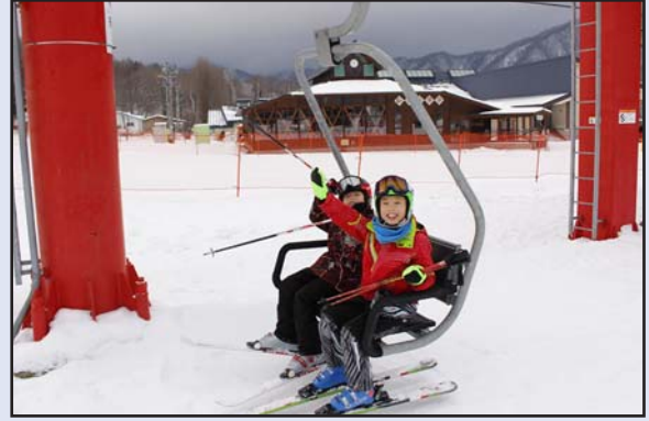
日高国際スキー場オープン