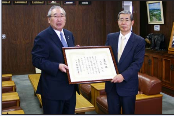
全国町村監査功労者表彰