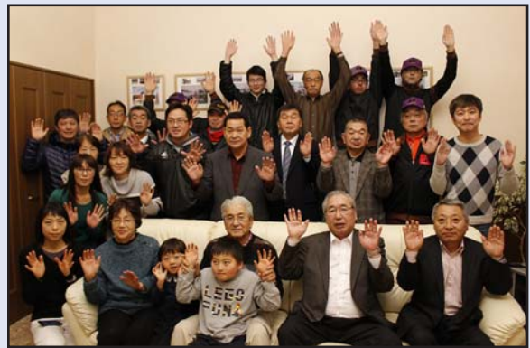
キタサンブラック号のG I 競走優勝レース