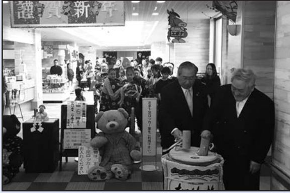
門別温泉とねっこの湯