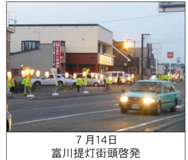
7月14日 富川提灯街頭啓発