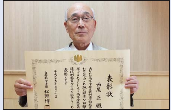
全国高等学校定時制通信制教育七十周年記念功績者 文部科学大臣表彰

2年連続となった全国大会出場にあたり、『8月に札幌市で開催される全国大会では頑張ります』と健闘を誓いました。