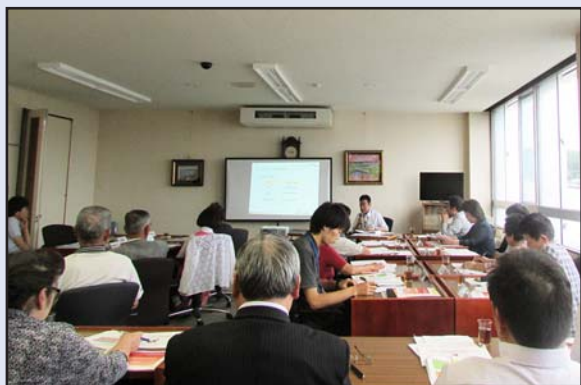
安心して暮らせる地域づくりを目指して

「社会を明るくする運動」は、すべての国民が、犯罪や非行の防止と、あやまちを犯した人の更生について理解を深め、それぞれの立場において力を合わせ、犯罪や非行のない安全で安心な地域社会を築こうとする全国的な運動です。