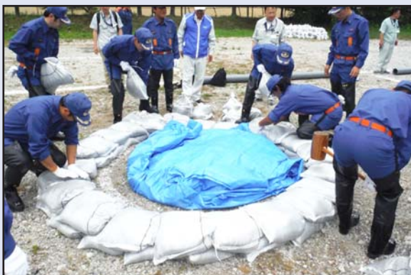
平成29年度日高消防団消防訓練

また、7月2日には厚賀西部地区町内会で会員41名による津波を想定した避難訓練が行われ、徒歩のほか車を使って2ヶ所の高台に避難しました。訓練終了後には役員が反省会を行い、実際に津波が来た時の課題などを熱心に話し合われました。