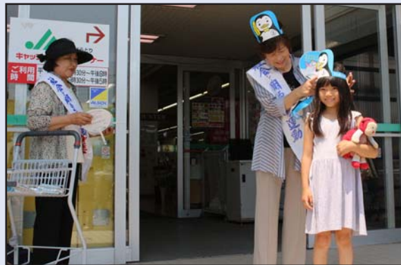
「社会を明るくする運動強化月間」