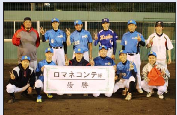
ナイター野球ロマネコンテ杯

また、北海道開発局室蘭開発建設部の災害対策車(排水ポンプ車・照明車)の展示、見学も行われました。