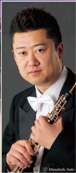
Oboe Miyagi Kanji