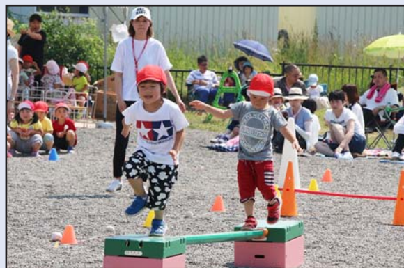
二葉保育所運動会

7月20日、地域の暮らしの課題や困りごとの解決策を一緒に考え行動する場として設立された「日高町地域支え合い推進協議体」の第1回会議が役場で開催され、町内のボランティア団体や自治会、自営業など様々な立場の方々、18名が委員として委嘱されました。本協議体では介護保険サービス以外の、地域活動やボランティア活動で高齢者の困りごとを支えあう体制づくりに向け、今後は地域の現状を知り、「あったらいい支え合い」「これならできる支え合い」などを話し合い、安心して暮らせる地域づくりを目指していきます。