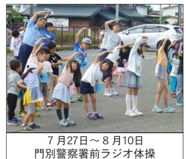
7月27日～8月10日 門別警察署前ラジオ体操