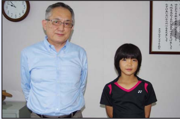
日高バドミントン少年団