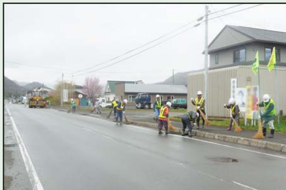
地域貢献活動として

運動会当日は若干肌寒い天候でしたが、寒さを感じさせない児童の一生懸命な姿に、訪れた保護者の応援にも力が入り、会場は終始大きな歓声で包まれていました。