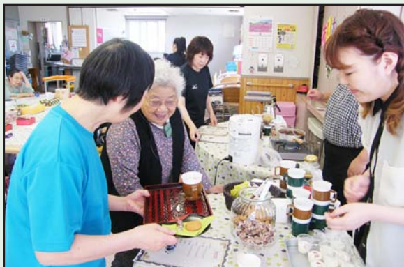
カフェ気分以小休憩