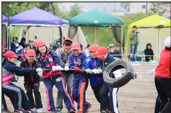
町内の小学校で運動会開催