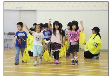
6月27日 こぐまクラブ交通安全教室