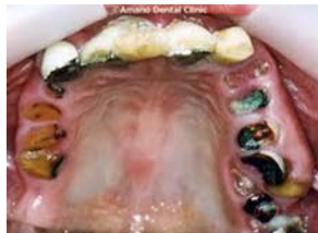
→重度の歯周病 （歯周病によって歯を支える骨が溶けている状態です）

写真のように虫歯や歯周病が悪化してしまうと治療が困難になります。節目年齢歯科健診も行っています。対象の方には案内を送っていますので、指定医療機関へ予約し、歯科健診を受診してください。