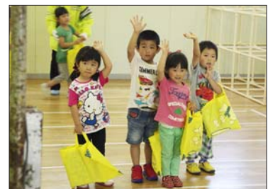
6月27日 こぐまクラブ交通安全教室