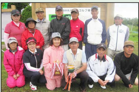
日高町合併10周年記念第19回日高地区パークゴルフ協会連合会大会

竹ぼうきとスコップで丁寧に清掃された歩道は町民が快適に歩けるよう環境が整いました。