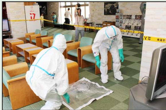
来館者に安心・安全な空間を

午後1時から3時までの間、やすらぎ荘の利用者は、コーヒーやクッキーなどの香りに包まれたやすらぎ荘のロビーで、くつろぎのひとつを堪能しました。