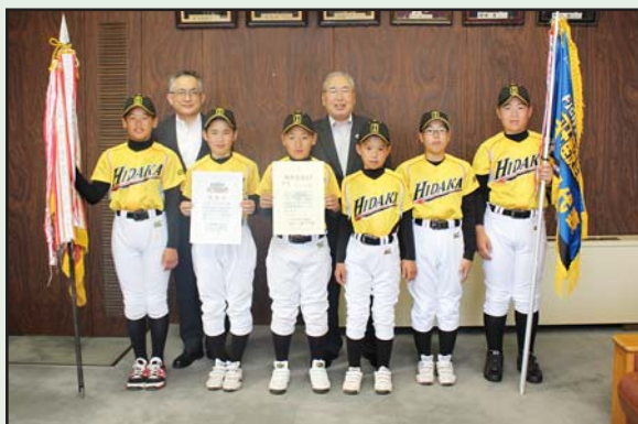
門別・富川・厚賀の合同野球スポーツ少年団「JBC日高ブレイヴ」

万が一に備え、不審物を発見した場合の対応を確認し、利用者の安全を確保するための訓練となりました。