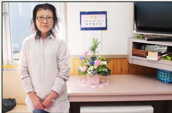
門別やすらぎ荘へ寄贈