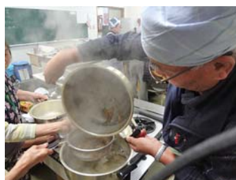
天然だしも自分たちでとれるようになります！