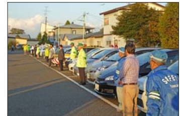
9月22日 門別地区交通安全協会 「車両パレード」