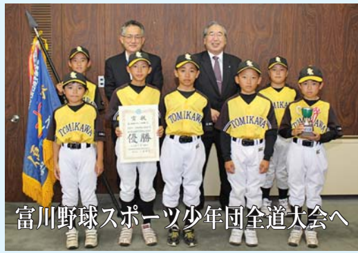
富川野球スポーツ少年団全道大会へ