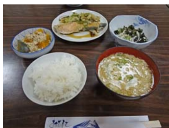
昨年は一汁三菜に挑戦してもらいました。

※申込締切りは、平成26年11月14日（金）までです。ただし、定員になり次第締め切ります。