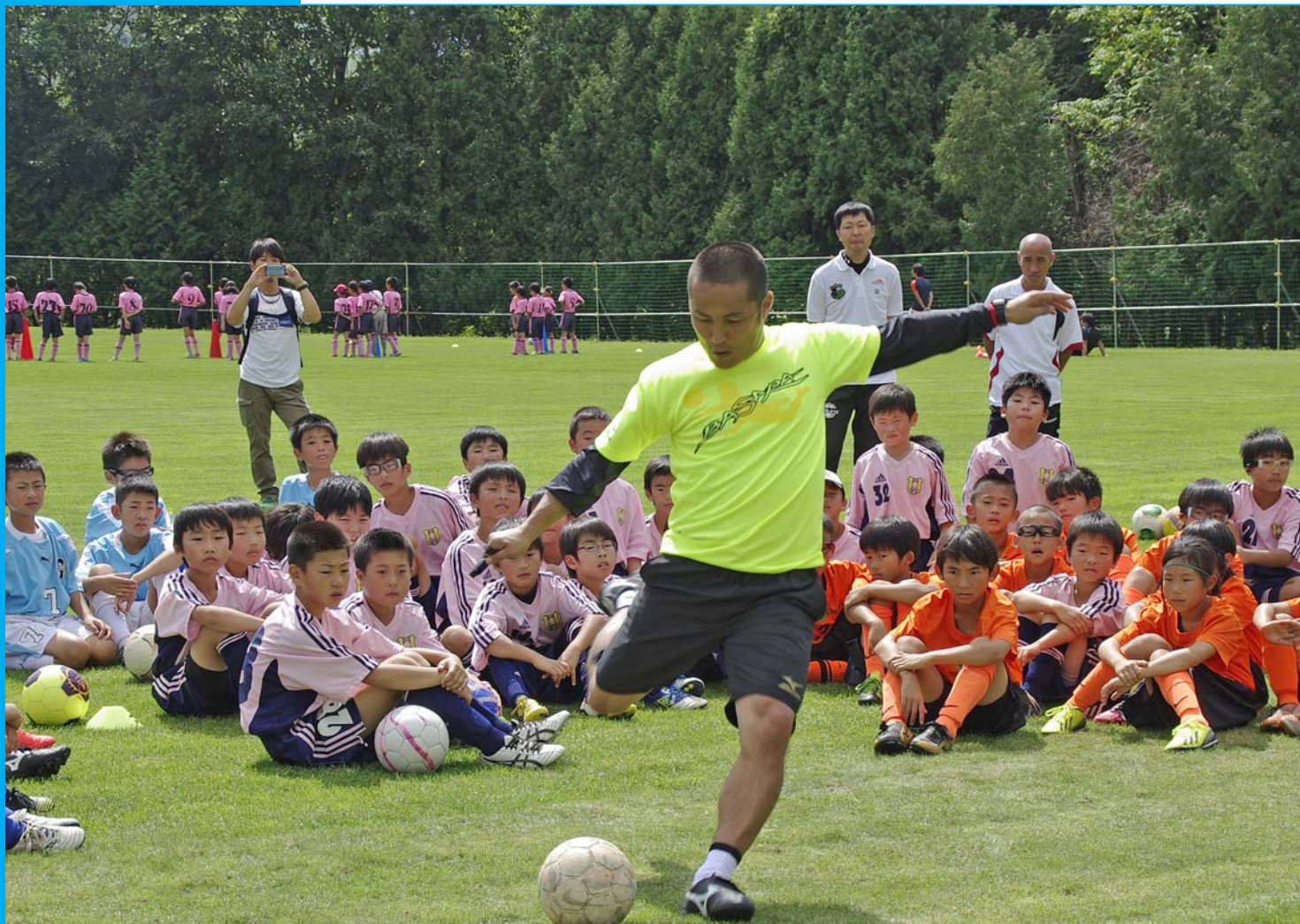
9月6日 森の広場サッカー場 サッカー教室