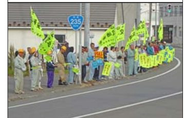
9月24日 日高町建設協会 「街頭啓発」