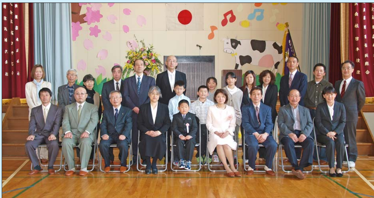
平成26年度 新一年生 (里平小学校)