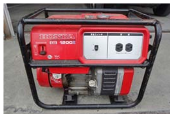
発電機 ② (ホンダ EB1200X)