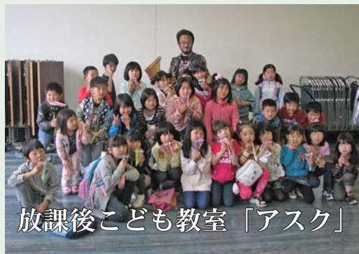
放課後こども教室「アスク」