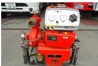
小型消防ポンプ (シバウラ TF-35MED)