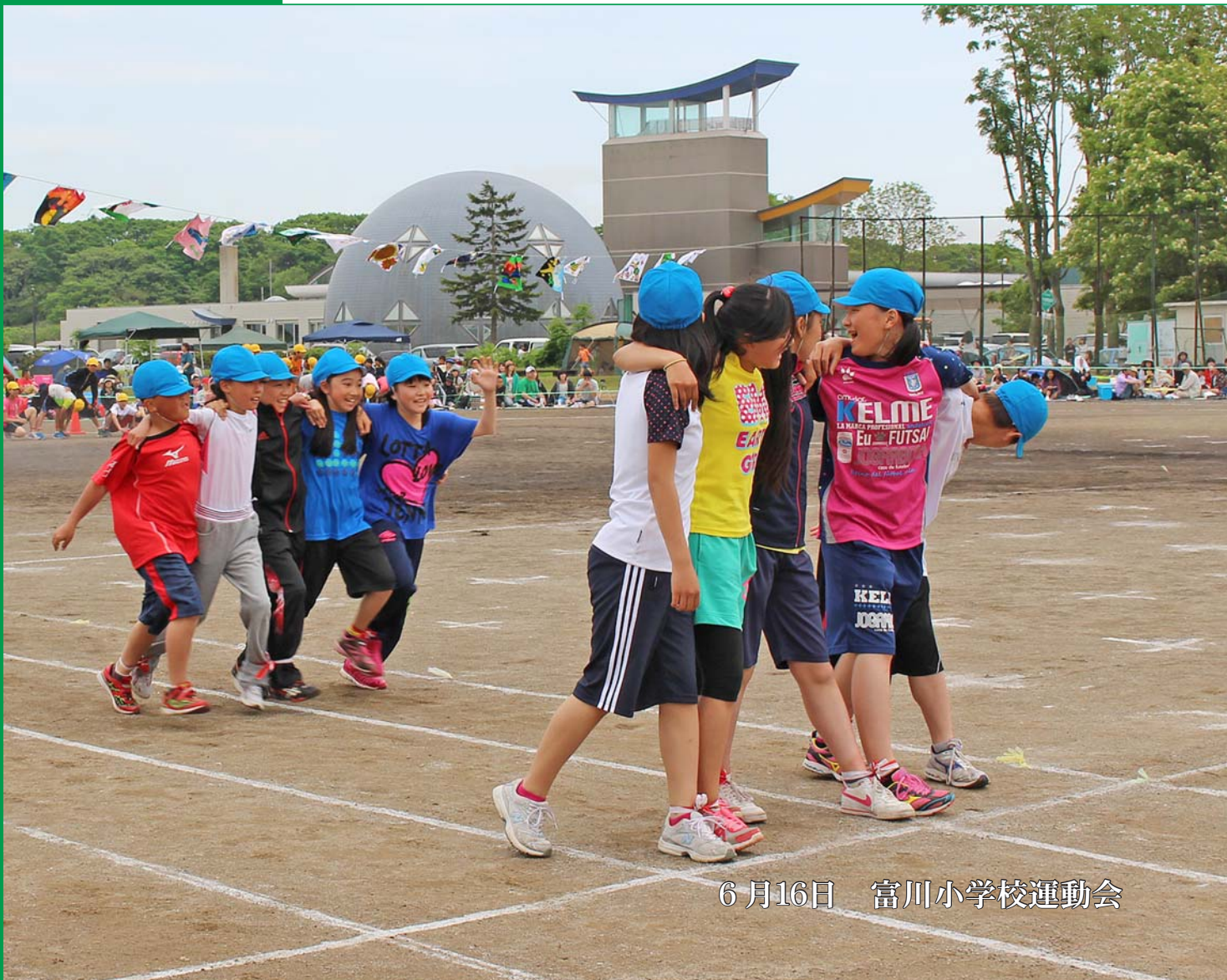
6月16日 富川小学校運動会