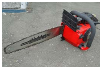
エンジンチェーンソー (新ダイワ E350AV)