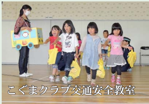
こぐまクラブ交通安全教室