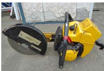
エンジンカッター ② (パートナー)