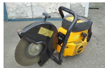
エンジンカッター ① (パートナー K500)