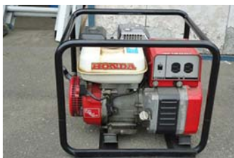
発電機 ① (ホンダ EC1200X)