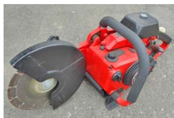
エンジンカッター ③ (新ダイワ EC80)