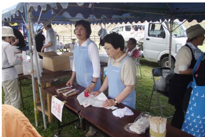
樹魂まつりでのつづ飯販売の様子