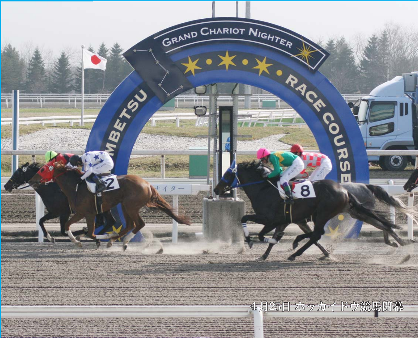
4月25日 ホッカイドウ競馬開幕