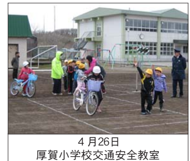
4月26日 厚賀小学校交通安全教室