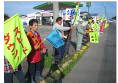
8月29日 事故防止厚賀住民大会