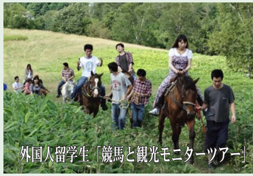
外国人留学生「競馬と観光モニターツアー」