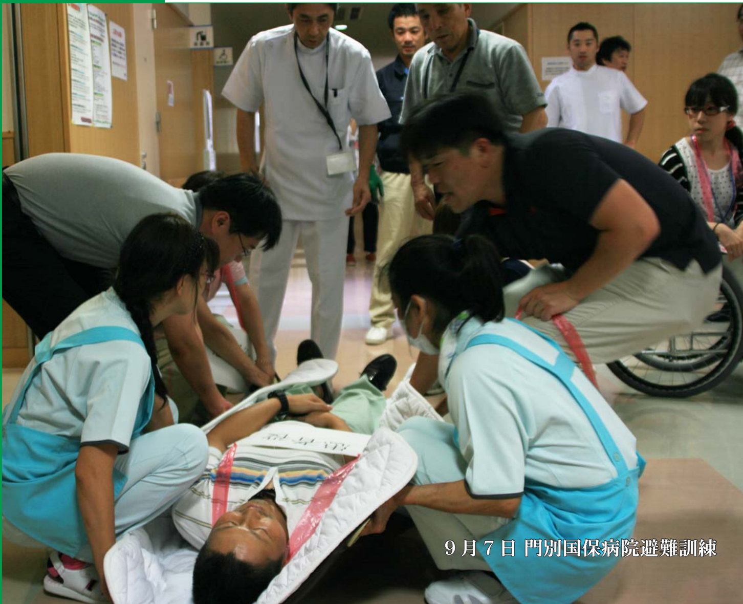
9月7日 門別国保病院避難訓練