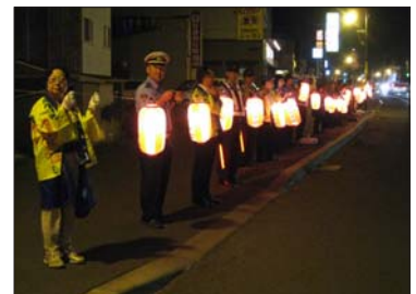
8月12日 富川提灯街頭啓発