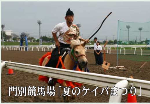
門別競馬場「夏のケイバまつり」