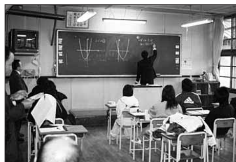
平成21年度の履修生は6名でした。