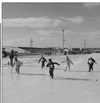
選手達の力強い滑り！