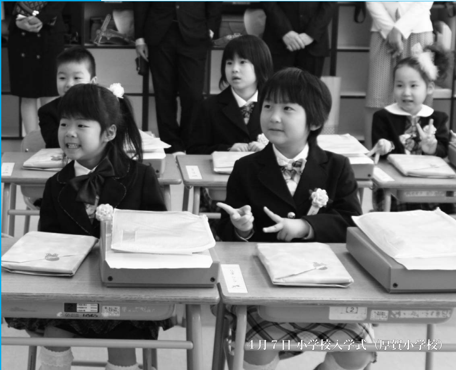
4月7日 小学校入学式（厚賀小学校）