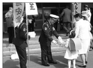
4月7日 新入学児童交通安全啓発