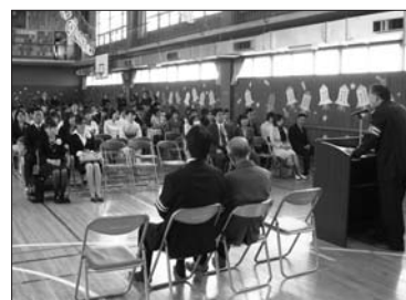
4月7日 新入学児童・父兄交通安全講話