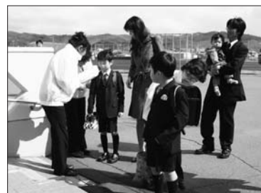
4月7日 新入学児童へ手作りの マスコットが贈られました