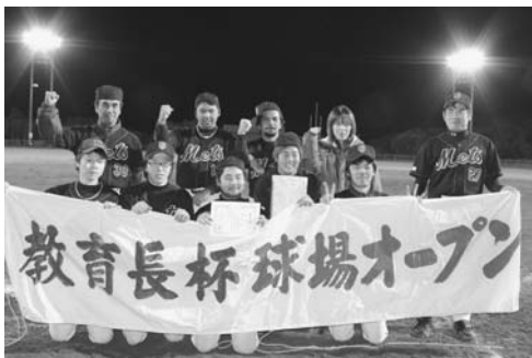
前年度優勝 富川メッツ

平成22年度の町営富川球場開きと野球を通し、地域社会の連帯意識の高揚と町営球場の利用促進を図ることを目的に次のとおり教育長杯町内野球大会を開催します。