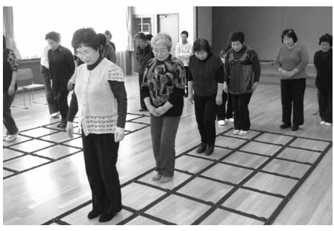
学習会でのふまネット体験の様子