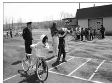
4月27日 交通安全教室（厚賀中学校）