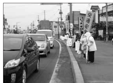
4月10日 交通死亡事故ゼロを目指す日