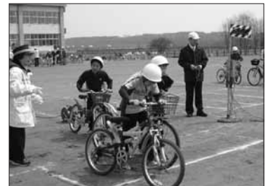
5月1日 交通安全教室 (門別小学校)