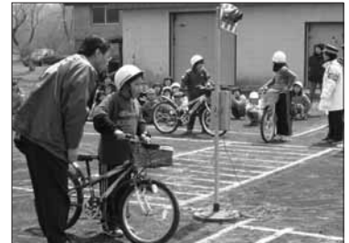
4月30日 交通安全教室 (厚賀小学校)