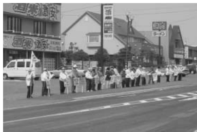
4月15日 道民交通安全の日 街頭啓発 国道237号