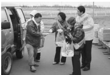
4月19日 交通安全街頭啓発 門別競馬場