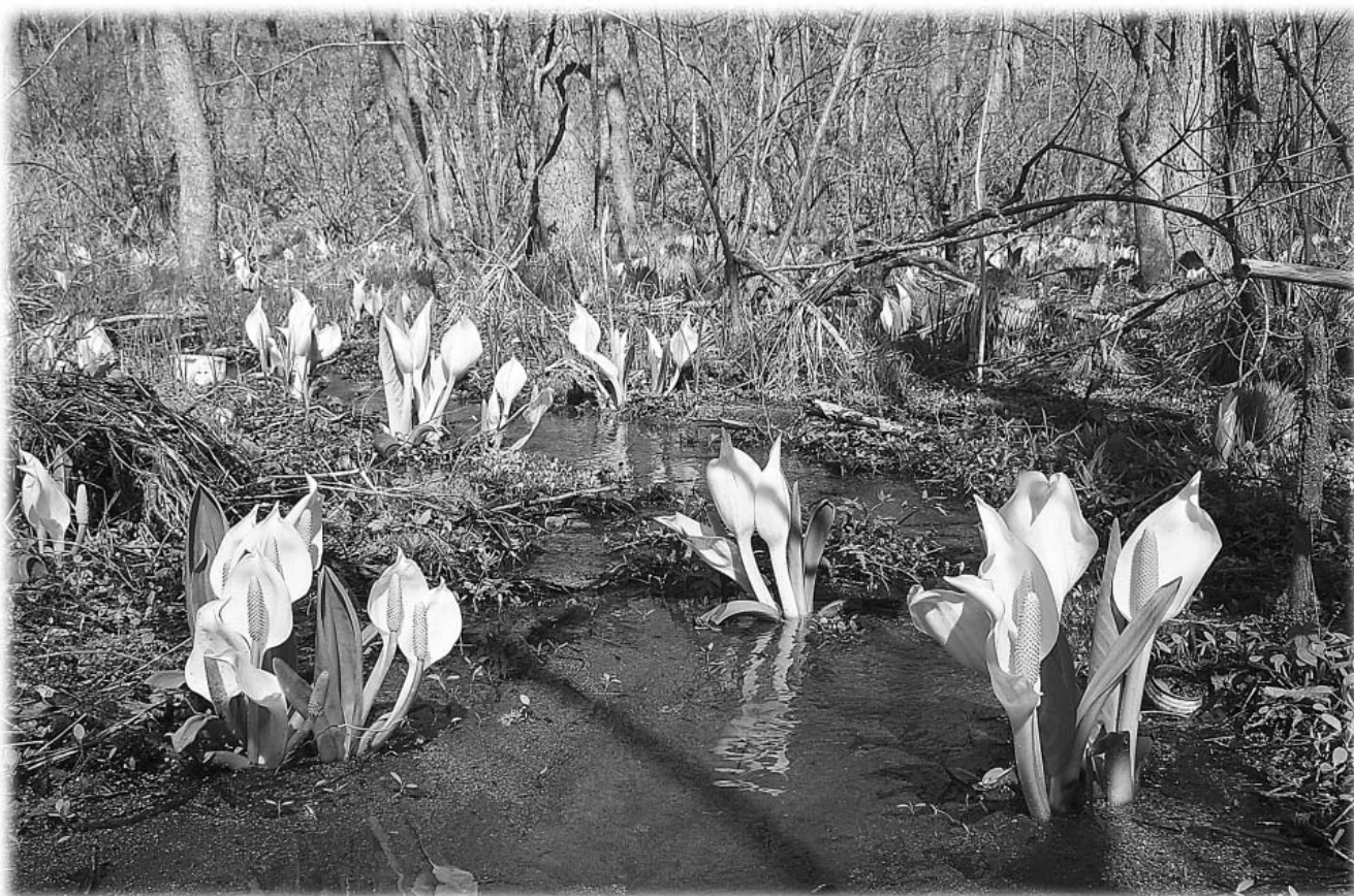
5 / 1 オコタン川水芭蕉群生地