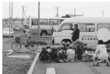
4月28日 交通安全青空教室 富川自動車学校