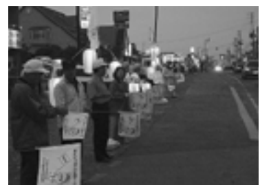
7 / 13 交通安全行灯啓発 (国道237号線)