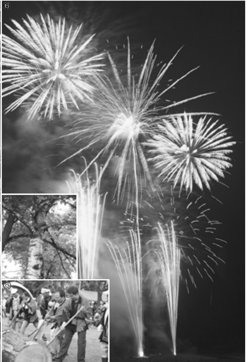
約300kgの丸太を5人1組で引く、流送レース。約20cmの丸太を切り落とす、木こりさん競争。見事な演奏を披露。陸上自衛隊第7音楽隊。木こりさん競争でお母さんを応援「がんばって!」。三輪町長も一緒に、観光踊りパレード。夜空を彩った花火1,500発。雨の落ちそうな天気でしたが何とか最後まで持ちました。木遣りに挑戦! 国際交流、北大留学生も祭りに参加。