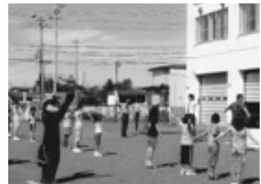
7 / 31 交通安全警察体操 (門別警察署前)