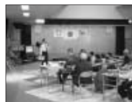
11 / 13 高齢者交通安全教室

最も理想的な措置は、アクセルやブレーキを戻すと同時に、本来の進行方向に目を向け、尻振りした方向と同じ方向にハンドルを素早く切り、それ以上の尻振りを食い止める - という「カウンターステア操作」を実行すること。