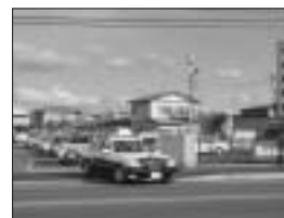
11 / 17 交通安全車両パレード