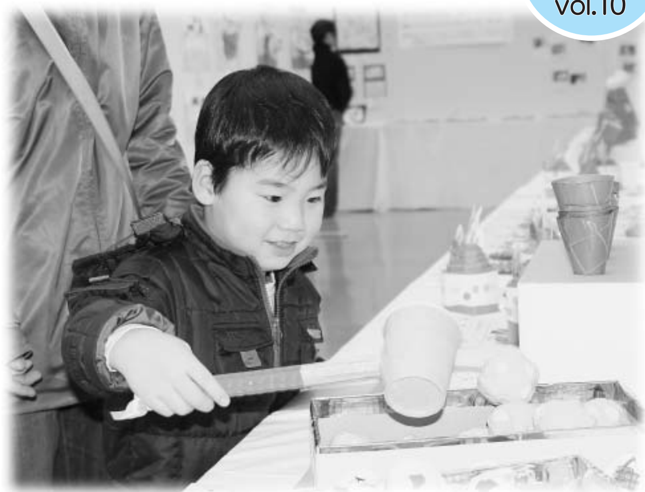
平成18年度「幼児作品展」