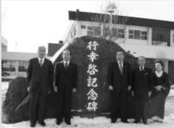
門別総合町民センター前に設置された記念碑