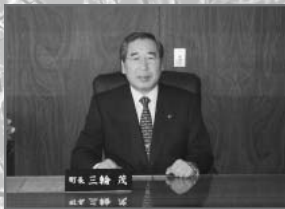
—町長— 三輪 茂

あけましておめでとうございます。 輝かしい希望に満ちた平成十九年の新春を迎えるに当たり、謹んで新年のお慶び申し上げます。