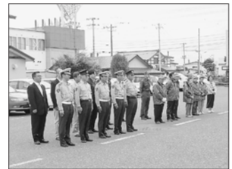
7月18日 車両パレード 出発式 門別警察署前