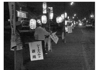
7月13日 交通安全行灯啓発 国道237号