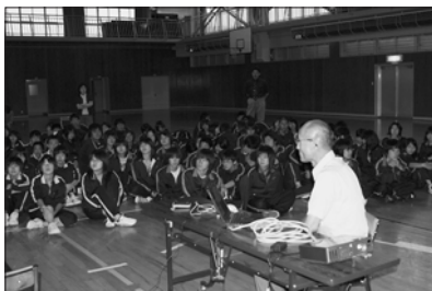
9 / 3 富川中学校