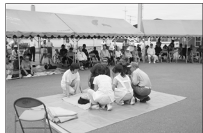
9 / 5 栄町・泉町町内会 愛生苑・門別長生園