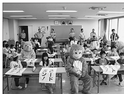
8月17日 子ども交通安全教室