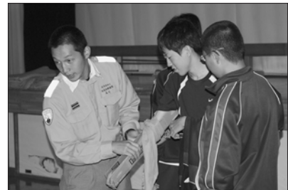
9 / 3 門別中学校