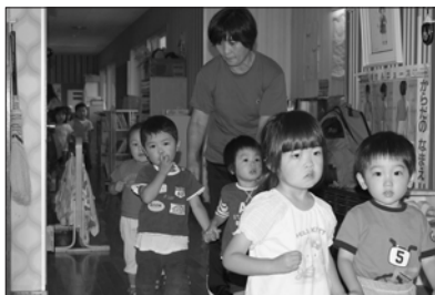
9 / 3 門別わかば保育所