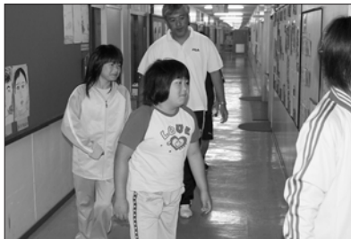
9 / 3 豊郷小学校