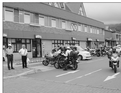
8月10日 バイク啓発の日