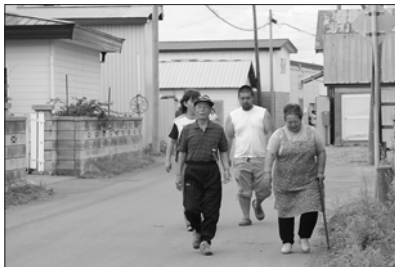
8 / 27 富浜自治会

いつ発生するか分からない災害。参加者は気象官や消防署員の話をも熱心に聞き、防災についての心構えを強くしていました。