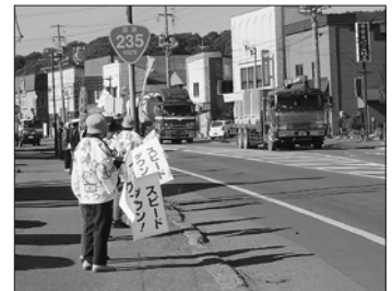
10月15日道民交通安全の日 街頭啓発 国道235号線