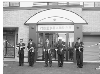
1月31日 門別警察署本町駐在所落成式