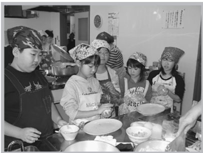
おにぎり上手ににぎれたかな？ ＝門別地区＝

く料理教室に参加でき、参加された子ども達の中では、朝食の欠食や孤食の傾向なく、食事時の挨拶もできていました。講師より、魚が食卓に並びまで魚がメタボリックシンドローム予防に注目されていること、川をきれいに、ゴミを捨てない、朝食を食べる、皆仲良くするなどの大切な講話も聞けました。