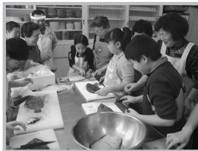
カレーと格闘中！ ＝日高地区＝