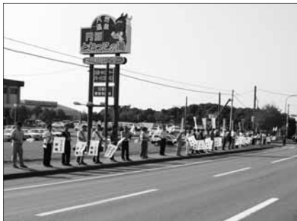
9月19日（門別総合町民センター前） 日高町・平取町合同街頭啓発