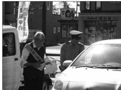
9月30日（日高道の駅） 「交通事故死0を目指す日」