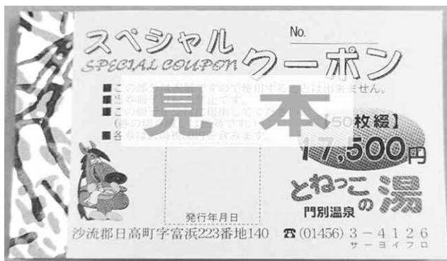
▲とねっこの湯のスペシャルクーポン券（見本）

問 町職員の責任で回収して金融機関へ納めるというのは同じ流れです。何故とねっこの湯の事件は警察に通報しなかったのですか。