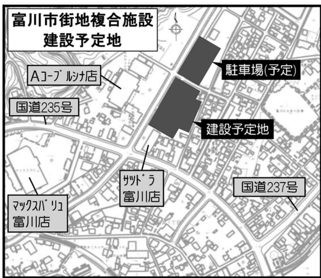
▲バスターミナル等建設予定地

また、バスの遅れは、大雪などにより遅れを生じることはありますが、普段は時刻表のとおり運行していると思われる。バスターミナル等建設予定地