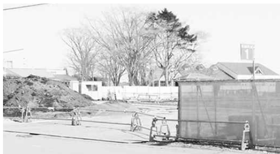
▲着工された富川の認定こども園

創設時に相当数の職員が必要ですので、現在雇用中の職員の意向にもよりますが、職員募集の対象としていただくよう協議を進めており、町保育士を対象とした説明会を行っています。