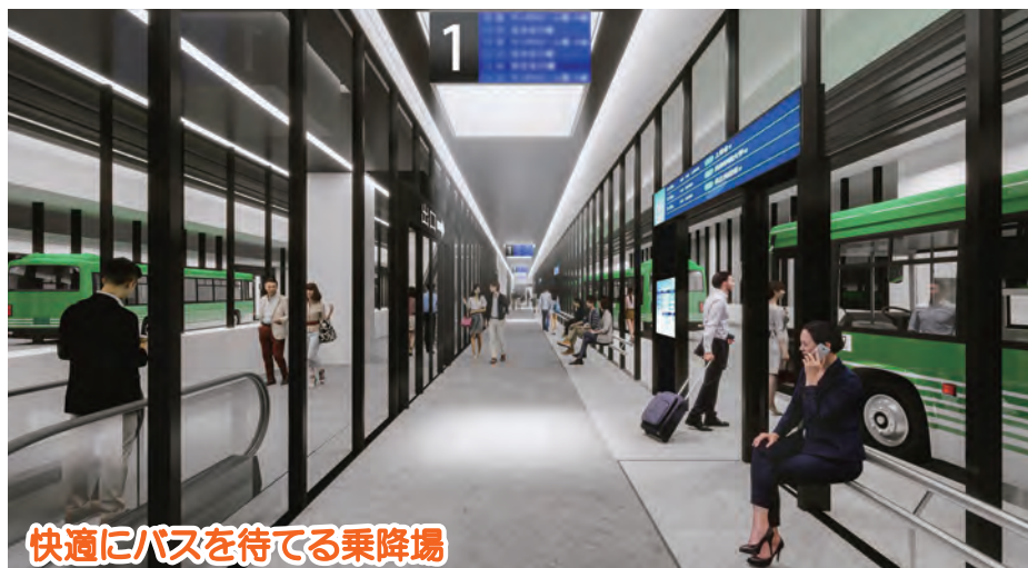
快適にバスを待てる乗降場

※建物外観や形状、内部レイアウト等はイメージであり、実態と異なる場合があります。