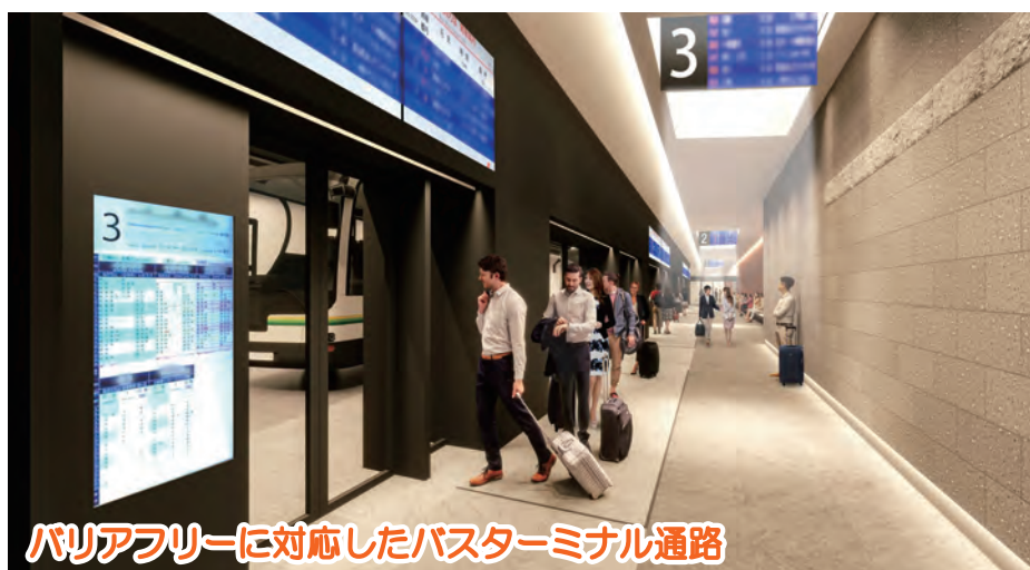
バリアフリーに対応したバスターミナル通路