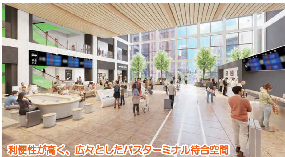
利便性が高く、広々としたバスターミナル待合空間