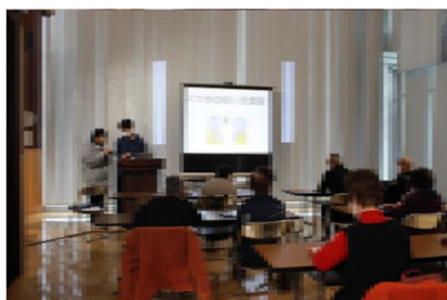
スマホの使い方講座

10月23日(月)に授業の一環で、生徒たちによる高齢者対象のスマホ教室を開催しました。当日は12名の町民に来校いただき、LINEの設定の仕方やスマートフォンの再起動の仕方等の疑問に生徒が応えていました。今回、教える側の立場となった生徒は、地域の方から感謝される経験をとおり、「楽しかった」、「準備していたことを役立てることができた」「大変だったけど企画してよかった。」等の喜びの声がありました。