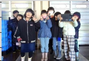
11月16日(木) 2年生 見学学習 厚賀漁協

発行時の予定ですので、変更等については「マチコミ」や学級通信などをご確認ください。