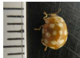
※写真はシロジュウシホシテントウ