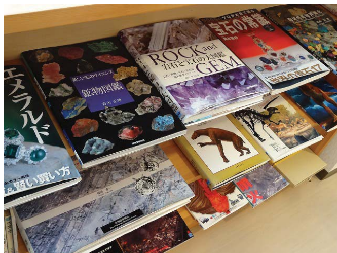
図鑑などの大型の図書も収蔵しています。図や写真もきれいで、博物館の主テーマの地質や岩石の分野を、ビジュアルからも楽しんでいただきたいと思います。