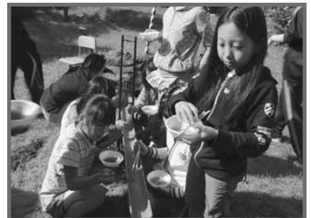
朝は流しソーメン! お腹いっぱい食べました。

7月30日～31日の2日間、1泊2日の日程で「思いっきり自然体験! グリーンアドベンチャー」が開催されました。