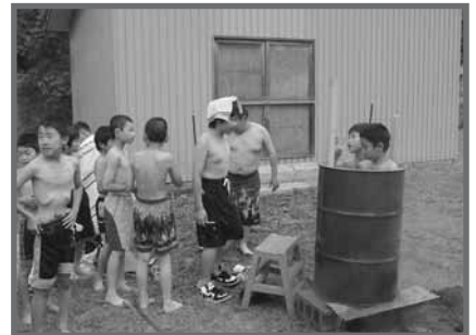
早く入りたあーい ドラム缶風呂は大人気!