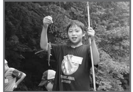
釣り上げたオショロコマ を手に記念撮影!