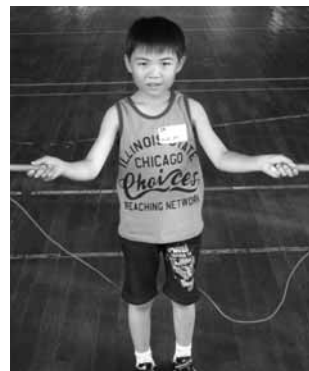
縄跳びチャンピオン！！