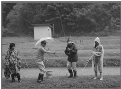
雨の中、次々にヤマメを釣り上げていました!