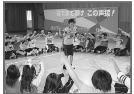
レクはみんな楽しそう。元気いっぱい、笑顔いっぱい!