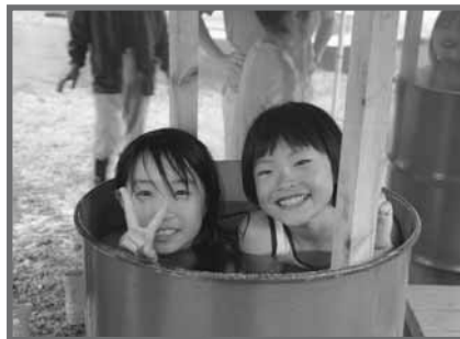
ドラム缶風呂は大人気! 温まりました。