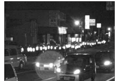
7月16日 国道237号線 交通安全提灯啓発